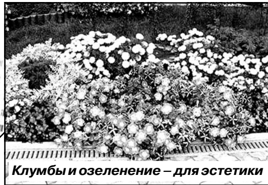
Клумбы и озеленение – для эстетики