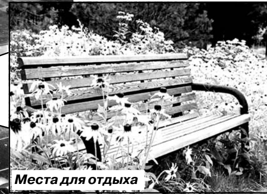
Места для отдыха