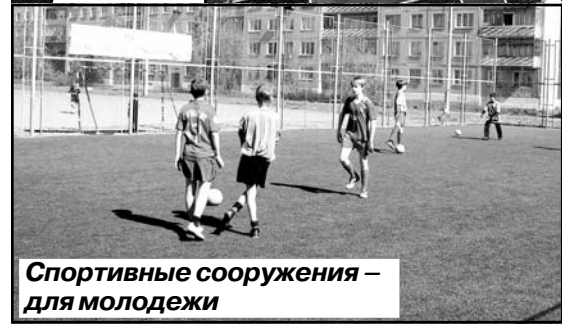
Спортивные сооружения – для молодежи