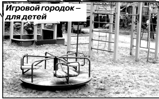
Игровой городок – для детей

езжают многотонные фуры. Огромные машины загораживают весь двор, проезжают мимо жилых подъездов, а там бегают дети, прогуливаются пожилые и мамы с колясками. Думаю, ради спокойствия и удобства жильцов, вполне возможно через ГИБДД запретить въезд на придомовую территорию большегрузному транспорту, а завозить товар в магазины на небольших машинах, например, «Газелях». Это будет цивилизованным выходом из ситуации.