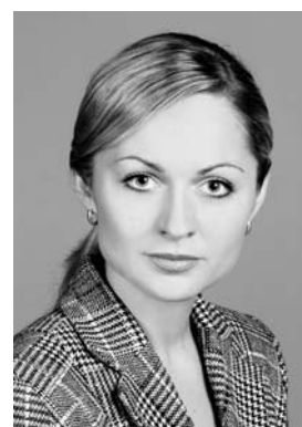
ИРИНА ЧИРКОВА, депутат Государственной Думы от Архангельской области:

го пробелов в нем существует, вследствие чего слишком много вопросов пока не имеют ответов. Будем надеяться, что очередное изменение в законодательстве не обернется для архангелогородцев и жителей всей области очередным повышением квартплаты и годами невыполняемым капремонтом.