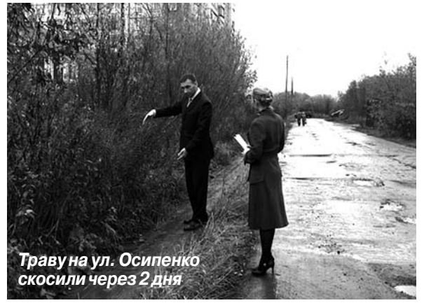
Траву на ул. Осипенко скосили через 2 дня