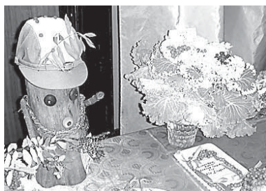
Экспонаты поразили посетителей уникальными творческими идеями

Первым «отличился» клуб «Космос», где 1 октября состоялся концерт, посвященный Дню пожилого человека, на который могли прийти все желаю-