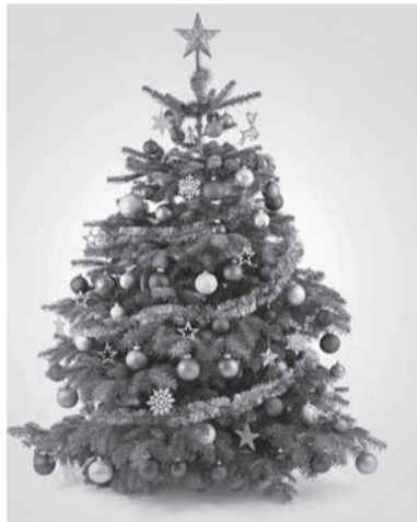
Предновогодние мероприятия для детей в ТРЦ «Макси» на пр. Ленинградском

24 ДЕКАБРЯ 2022 13:00-14:00 – Мастер-класс «Новогодние открытки» 14:00-16:00 – Приёмная Деда